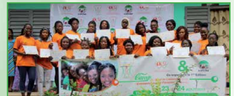
Camp de l'Eveil du Leadership et de l'Entrepreneuriat Féminin du Bénin (CELEF), initié par WoLSI et coorganisé avec CIPCRE-Bénin

1- Appui à l'auto-emploi des jeunes : Appui à la formation et/ou à l'insertion professionnelle des jeunes non scolarisés et déscolarisés ; Appui technique et logistique à l'auto-emploi des jeunes diplômés ; Formation à l'entrepreneuriat. 2- Facilitation de l'accès des jeunes à l'emploi salarié : Renforcement des capacités ; Appui-accompagnement.