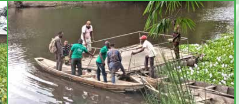
Pisciculture en cages flottantes dans le fleuve Ouémé