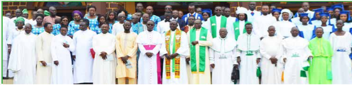
Mobilisation interrégionale (MIR) "Campagne Néhémie pour la sauvegarde de la création"