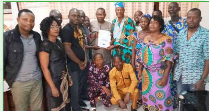
Remise au Maire de Dangbo d'un Mémorandum d'entente proposé par les OSC/OCB pour une gouvernance participative

Influence des politiques locales (Renforcement des capacités des décideurs locaux, Appui-accompagnement, Plaidoyer auprès des autorités et du personnel technique pour une bonne gouvernance locale).