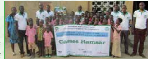
Education Environnementale (école verte)

4. Ecole Verte (Education Environnementale en milieu scolaire) : Promotion du militantisme écologique ; Vulgarisation et appuis à l'élaboration du Plan d'Aménagement de l'Espace Scolaire (PAMES) ; Gestion écologique de l'école (verdissement et propreté du cadre scolaire).