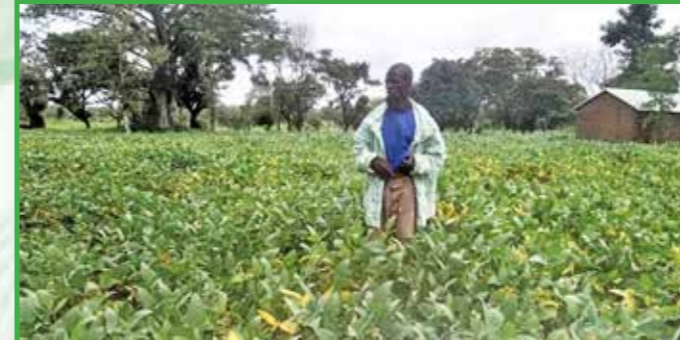
Mesures GDT : champ de soja (rotation, compost, semence certifiée) à Kom'dè/Ouaké

4. Renforcement de l'alimentation et de la nutrition des ménages agricoles : Transformation / valorisation des produits alimentaires locaux ; Education nutritionnelle et sensibilisation des ménages vulnérables (ANJE, SMI, EHA).