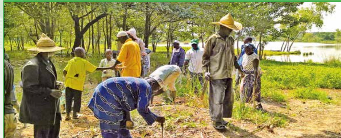
Usagers d'un site à enjeux GIRE (barrage de Kom'dè) en activité de lutte contre l'érosion

NB : Pour chaque bloc thématique, il sera tenu compte de mesures d'adaptation au changement climatique.